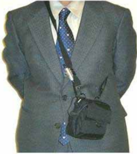
お手持ちのカバン等に入れた状態