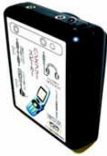
ハンズフリースピーカー本体