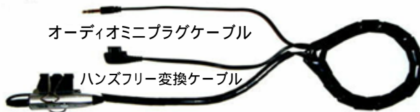
オーディオミニプラグケーブル