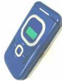
携帯電話本体 (携帯電話はお客様がご用意下さい)