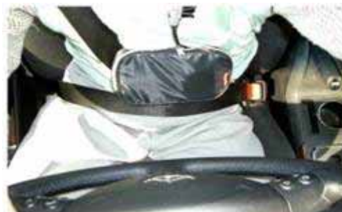
シートベルトを装着、安全運転ができます。