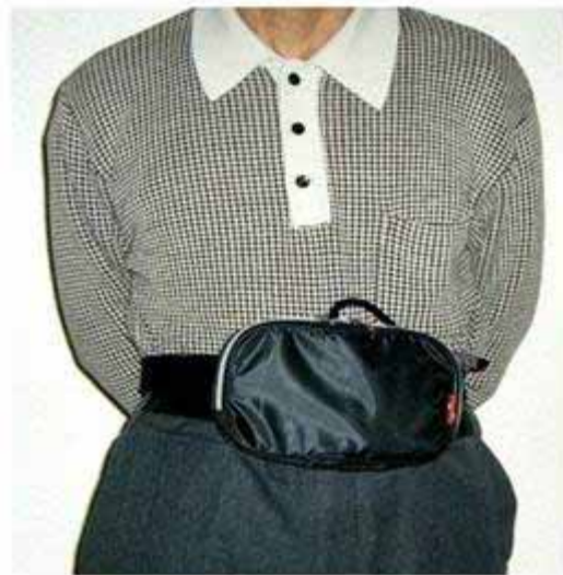
専用のポーチを使用した状態