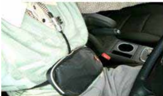
ハンズフリースピーカーを身体に装着。